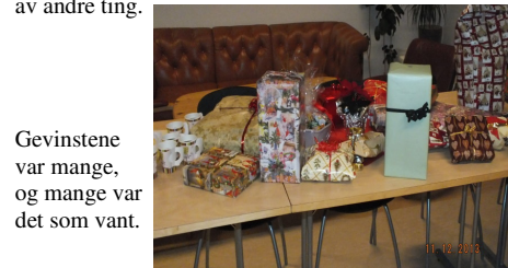
Gevinstene var mange, og mange var det som vant.