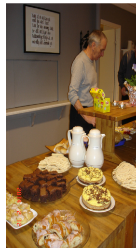
Gevinster til kveldens utlodning ligger klar