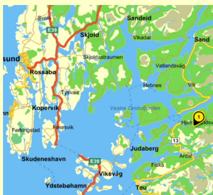
Ryfylkebasenget med omkringliggende fjorder

Alle betaler til Hjelmeland Sparebank: Konto 3353 22 23259 Betaling må være inne på konto senest fredag 29. mai.