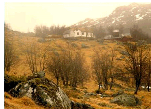
Ritland gården i det fjerne