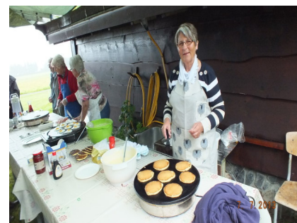
Gunvor tar seg her av de amerikanske pannekakene.