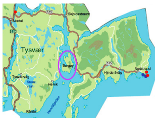
Borgøy i Tysvær kommune.