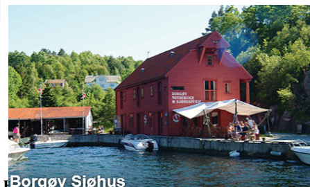
Borgøy Sjøhus https://www.facebook.com/BorgoySjohus