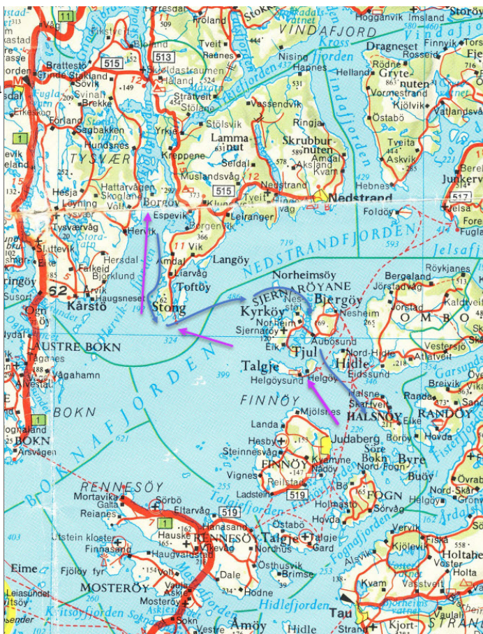
Kart over ruten vi reiste. Lilla piler viser ruten fra Fiskå til Borgøy. Blå piler viser ruten tilbake fra Borgøy, via Sjernerøy Marime på Bjergøy; så Aubusund via N-Hidle, Halsnøy, Randøy til Fiskå i 17-tiden.

Til slutt: Som i fjor – "alle" syns det var ein gild tur. Det kunne vært noe varmere i været, bare. Spesielt var det kjekt å se noen nye ansikter. Vi ble 43 pass. til slutt. Tau. 19.07.15 K.S.A. ref.