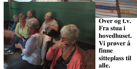
Over og t.v. Fra stua i hovedhuset. Vi prøver å finne sitteplass til alle.