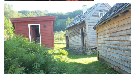
Vi ser Sissela-huset bak, midt i bildet. Huset har pipe gjennom taket.