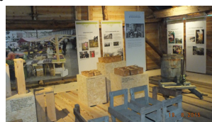
Fra utstillingen i løa (over) og i stabburet (til venstre)