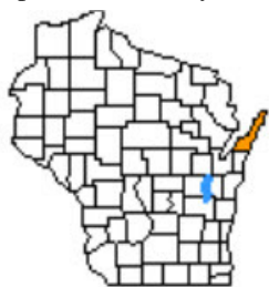
Staten Wisconsin med Door County (gul farge)