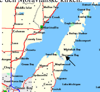
Door County omtrent fra Dyckesville og nordøstover i Lake Michigan