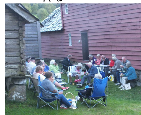
Matøkt til slutt utpå tunet. Hovedhuset er rødmalt.