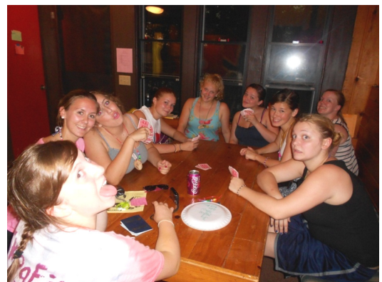
Her er vi som bodde i hytta (bilde fra Hamar Lodge)