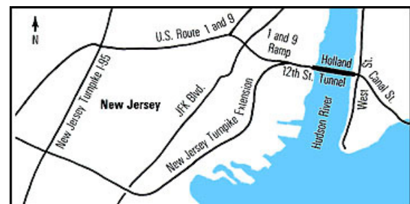
Holland tunnelen som forbinder Jersey City og øya Manhattan, New York under Hudson River