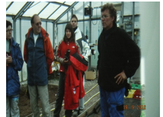
Bildet er tatt fra fremvisningslerretet, og viser turister som besøkte Jostein i drivhuset.