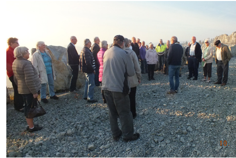
Her står vi samlet oppe på et av de øverste platåene i «amfi», klar til å høre etter.