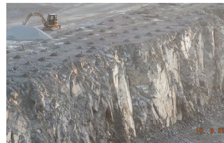
Her ser man boremønsteret som små hauger oppe på bruddkanten.