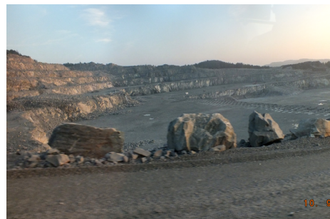
Vi ser mot sørøst (antar jeg), og kan ane dybden av bruddet til høyre i bildet med bruddkanten der det er klargjort for sprengning.