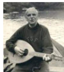
Jakob Sande (1.12.1906-16.3.1967) http://www.uskedalen.no/image/pageimage/hu ge/Nyhende2006-2007/september_2006/bilde.jpg