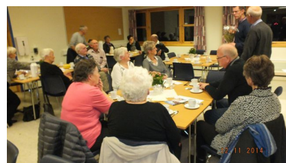
Bildetektst – se nedenfor